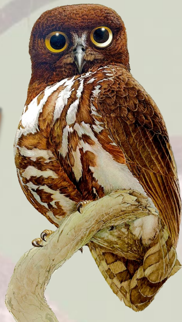
アオバスク 齋藤壽 作

Birds in Emperor and Empress's tanka poem