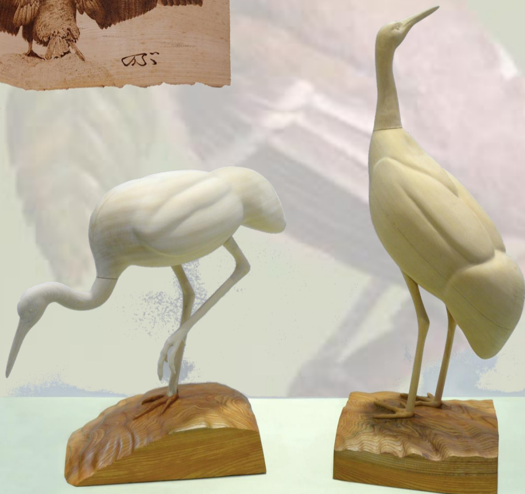
タンチョウ 水上清一 作