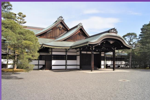
京都大宮御所御車寄